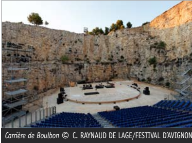
Carrière de Boulbon

Une autre difficulté survient en extérieur, qui est celle de la lumière naturelle. L'acte III a lieu à midi, l'acte V en journée, alors que le spectacle sera joué de nuit.