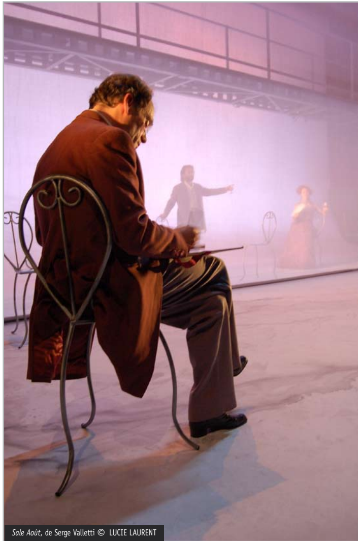
Sale Août , de Serge Valletti