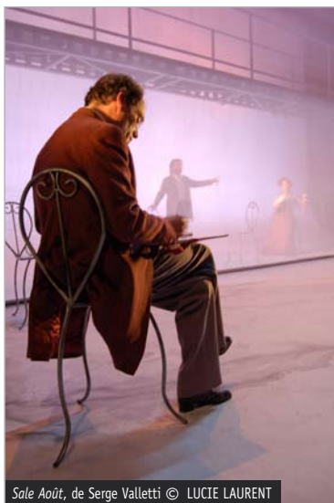
Sale Aout , de Serge Valletti © LUCIE LAURENT

L'espace est souvent démultiplié, que ce soit dans la profondeur avec un rideau en voile, ou en hauteur avec un échafaudage. Remarquer la présence régulière de cadres, de tableaux, de portes, qui sont autant d'emboîtements, et de mises en abyme.