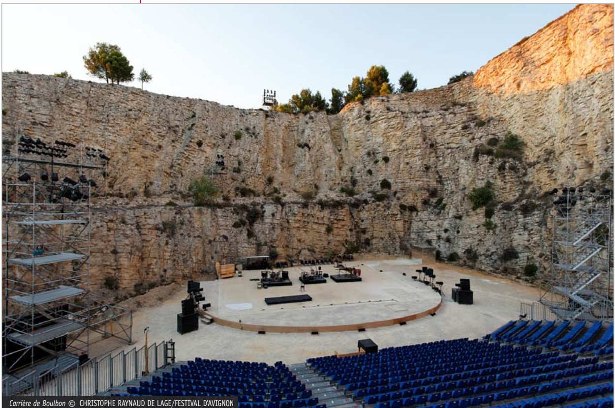
Carrière de Boulbon